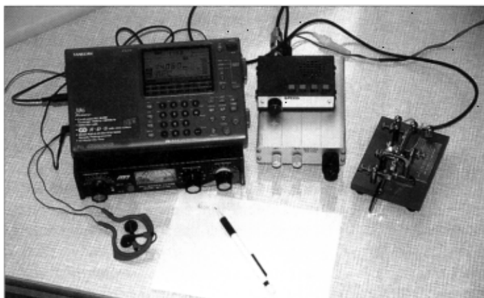
Der ATS-909 eignet sich auch gut als Empfänger für die QRP-Station. Neben dem ATS-909 sind der MFJ-Tuner 945, der QRP-Transceiver T40P und der Superkeyer II zu sehen. Zum sauberen Mithören des Sendesignals muß die Empfangsantenne während des Sendens vom ATS-909 abgetrennt werden.

Steht kein solches Anpaßgerät zur Verfügung, kann man dieses Manko mit einer größeren Antennenlänge ausgleichen. Diese Zusatzantenne kann durchaus in der Wohnung oder im Hotelzimmer ausgelegt werden, sofern man Schaltnetzteile, Fernsehgeräte und Computer weit genug entfernt hält. Auch DX-Empfang ist in jedem Fall mit einem Draht von wenigen Metern Länge möglich. Manche deutschen Stationen hätten sich bestimmt gewundert, wenn sie gewußt hätten, wie laut und klar ihre mehr oder weniger erfolglosen CQ-Rufe während des WAE-SSB-Contests '98 am Sonntagmorgen in meinem Hotelzimmer in Kapstadt zu hören waren. Eine Außenantenne ist natürlich vorzuziehen, in diesem Fall kann aber die Antennenspannung evtl. so groß sein, daß es nicht ohne einen externen Abschwächer geht, weil der Umfang der HF-Handeinstellung dafür nicht mehr ausreicht. Ich habe den Abschwächer als 500- \Omega -Potentiometer mit in das Anpaßgerät eingebaut.