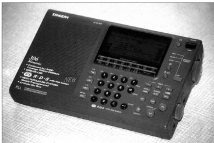
Der Weltempfänger ATS-909 überzeugt neben seinem ordentlichen UKW-Empfang speziell den Funkamateurl durch gute Kurzwelle-eigenschaften. SSB- und CW-Stationen lassen sich mittels des großen Abstimmknopfes auf der rechten Seite in 40-Hz-Schritten feinfühlig abstimmen.

Für wirklich optimalen Empfang, auch von schwachen Signalen, ist vor allem unterhalb 10 MHz eine Anpassung der Antenne empfehlenswert. Ich habe eine einfache L-Schaltung aus Festinduktivitäten und einem Rundfunkdrehkondensator (etwa 300 pF) aus einem ausgedienten Taschenradio aufgebaut (Bild). Die Induktivitäten (1 µH; 2,2 µH; 4,7 µH; 6,8 µH; 10 µH;